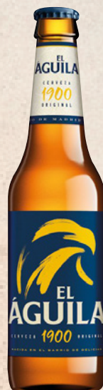
EL ÁGUILA 20cl