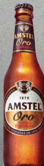
AMSTEL ORO 33cl