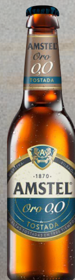
AMSTEL ORO 0.0 33cl