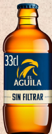
ÁGUILA SIN FILTRAR 33cl