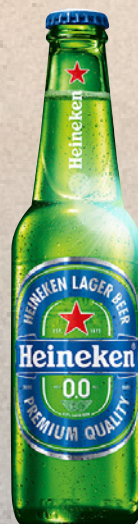
HEINEKEN 0.0 25cl