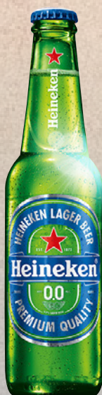
HEINEKEN 0.0 33cl