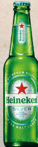
HEINEKEN SILVER 25cl