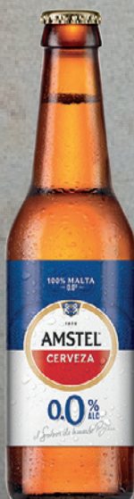
AMSTEL 0.0 33cl/20cl